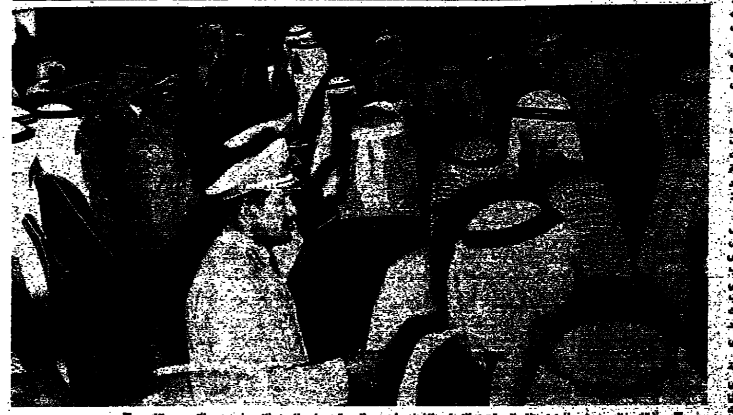
الملك خالد بن عبد العزيز يناقش البعثة من العراق والشخصيات ، والى جانبه ولي العهد الامير نهد ، والجمهورية الله ( جورة بن بعة « الاتوار » )